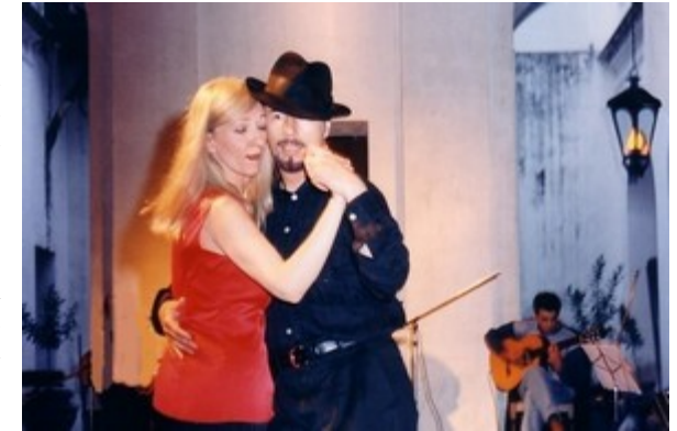
Tangovorführung zu Livemusik im Cabildo von Montevideo

Im Tangounterricht wird die Struktur des Tanzes vermittelt. Das geschieht unter anderem durch beispielhafte Figuren, an denen das Prinzip des getanzten Tangos besonders deutlich erkennbar und erfahrbar wird. Wenn man einmal die Grammatik des Tangos verstanden hat, ist man frei und im Prinzip auch befähigt, selbst Übergänge zu entdecken und damit Figuren zusammenzusetzen, selbstverständlich auch Sacada-Figuren. Diese Möglichkeit, mit den Bausteinen